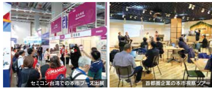
セミナー台湾での本市ブース出展