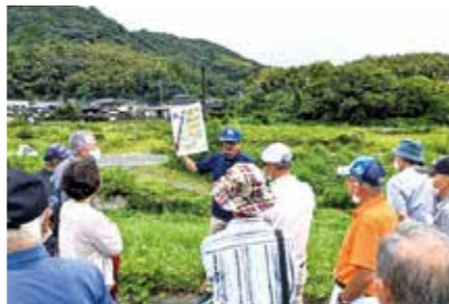
防災バスツアーの開催