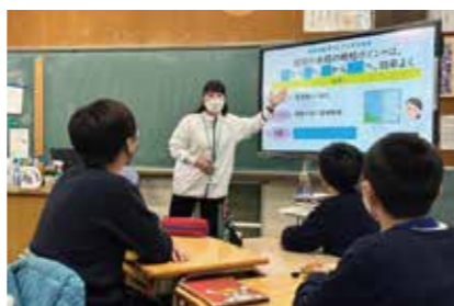
地域と企業等を結ぶ応援事業