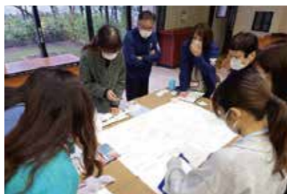
地元高校生による地域の活性化