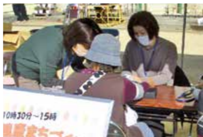
校区単位の健康まちづくり