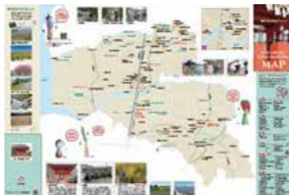
史跡等を巡るデジタルスタンプラリー開催