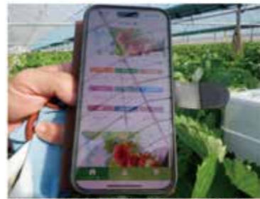
ビニールハウス内環境モニタリング 温度や湿度等の環境をモニタリングして見える化