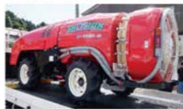
乗用型薬剤散布機(樹園地) 農薬等を均一に散布可能⇒防除作業を効率化