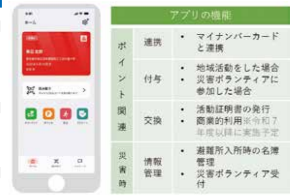
※こちらはあくまで画面イメージです。実際にリリースするアプリ画面とは異なる場合があります。