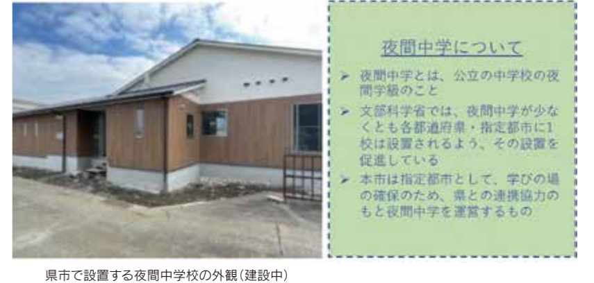
県市で設置する夜間中学校の外観(建設中)

夜間中学について > 夜間中学とは、公立の中学校の夜間学級のこと > 文部科学省では、夜間中学が少なくとも各都道府県・指定都市に1校は設置されるよう、その設置を促進している > 本市は指定都市として、学びの場の確保のため、県との連携協力のもと夜間中学を運営するもの